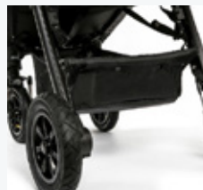
Pojemny kosz na akcesoria i zakupy