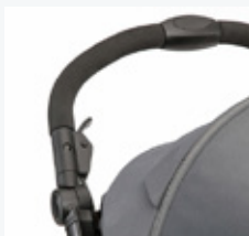
Ręczny hamulec zabezpieczający