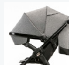
Budka z dodatkową regulacją i rozkładanym daszkiem