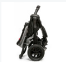
Wózek składany jednym pociągnięciem