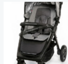
5-cio punktowe pasy, barierka zabezpieczająca i dodatkowy pas krokowy