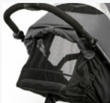
Okienka wentylacyjne w budce