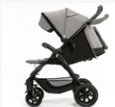
Regulowane siedzisko, podnóżek i rączka